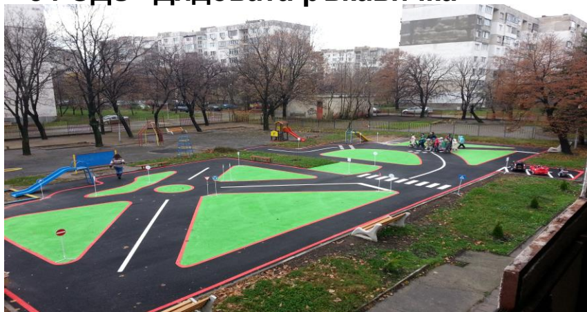
54 ОДЗ “Дядовата ръкавичка”