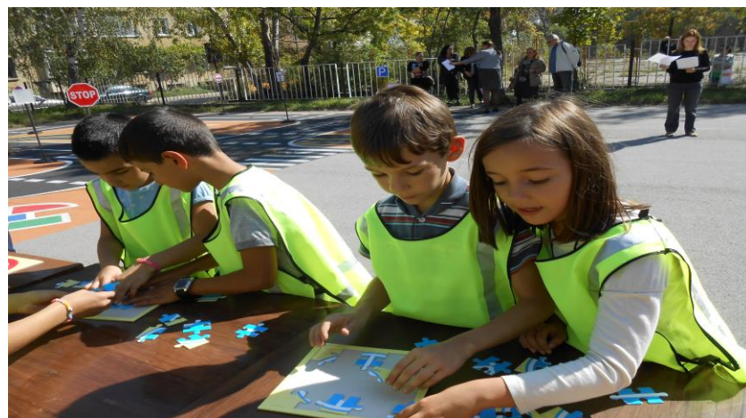
132 СОУ “Ваня Войнова”