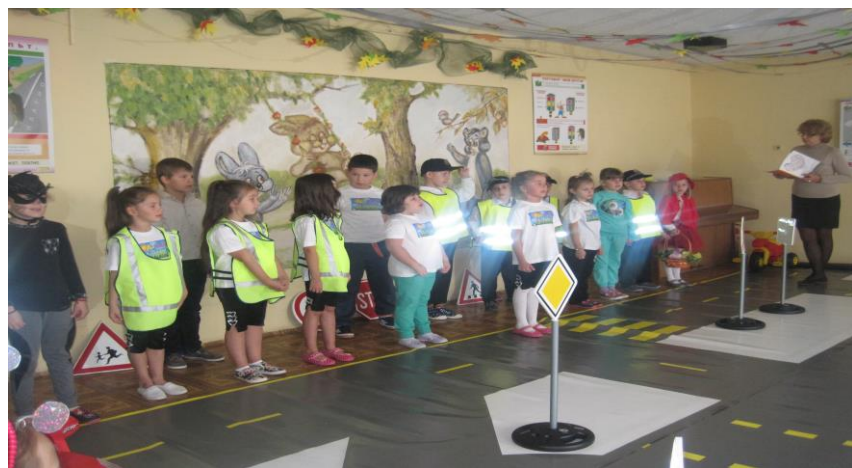
5 ОДЗ “Иглика”