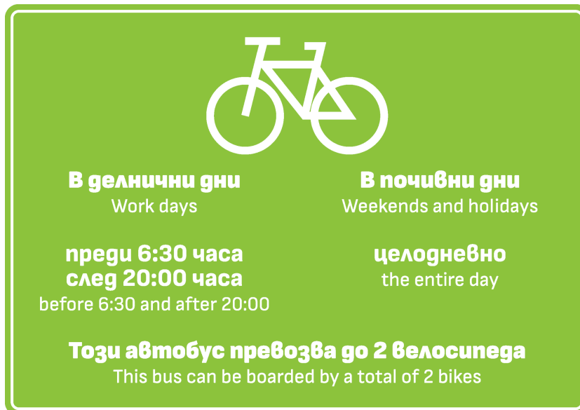
Фиг. 1. Оформление на информационен стикер за условията за превоз на велосипеди в превозно средство на градския транспорт

Предлагаме целодневен превоз на велосипеди в метровлаковете, т.к. превозния им капацитет е достатъчно голям и позволява безпроблемното транспортиране на велосипеди в последния вагон на всеки метровлак без това да създава проблеми за пътниците.