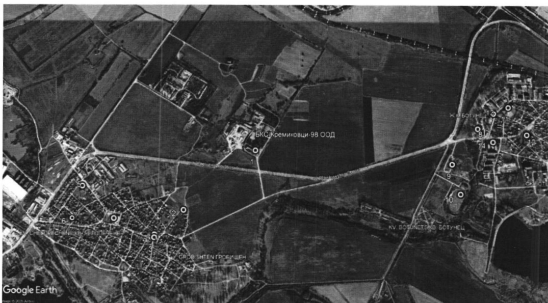
Фигура 3 Обекти, подлежащи на здравна защита

Не се очаква въздействие върху незасегнат досега компонент на околната среда.