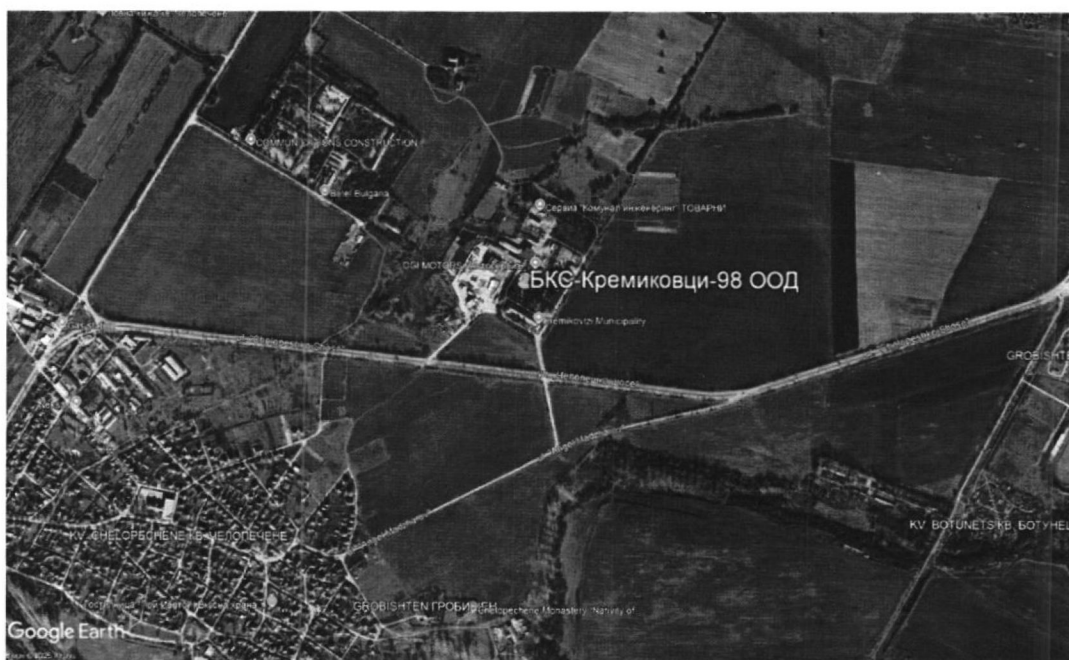
Фигура 1 Местоположение на „БКС-КРЕМИКОВЦИ-98“ ООД

Имотът, в който ще се реализира инвестиционното предложение е разположен гр. София, поземленият имот е с идентификатор 68134.8504.5 по плана на гр. София. Копие от скица на имота е представено в Приложение №3.