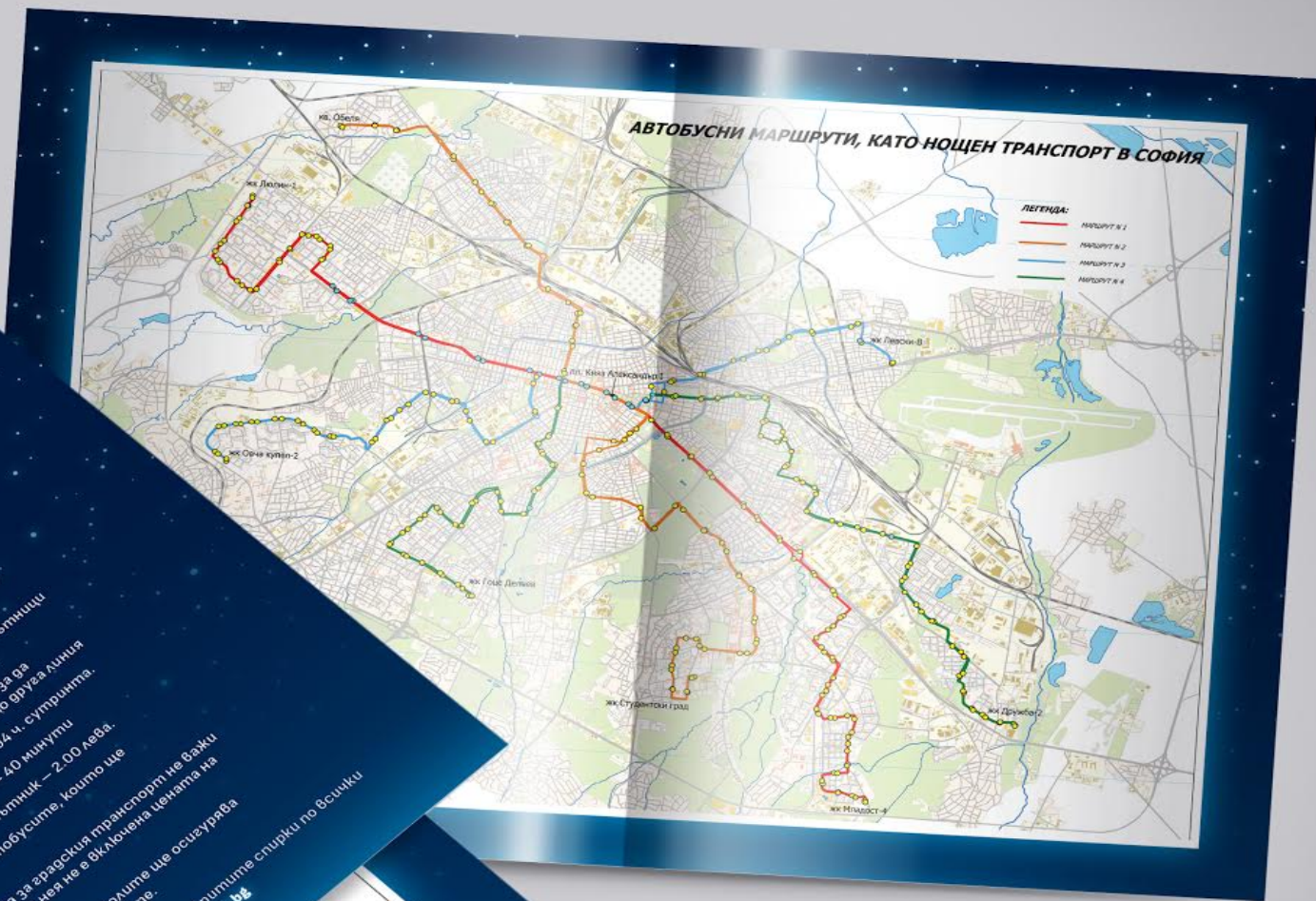
Карта на автобусните маршрути