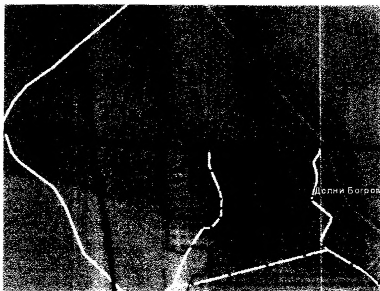
Фиг. 3. Карта на защитена зона „Долни Богров - Казичане“ с код BG 0002004

Втората е с код BG 0002114 «Рибарници Челопечене» по Директива 79/409/ЕЕС за запазване на площта на природните местообитания и местообитанията на видовете и техните популации, и отстои на около 3800м. от поземления имот (фиг. 4).