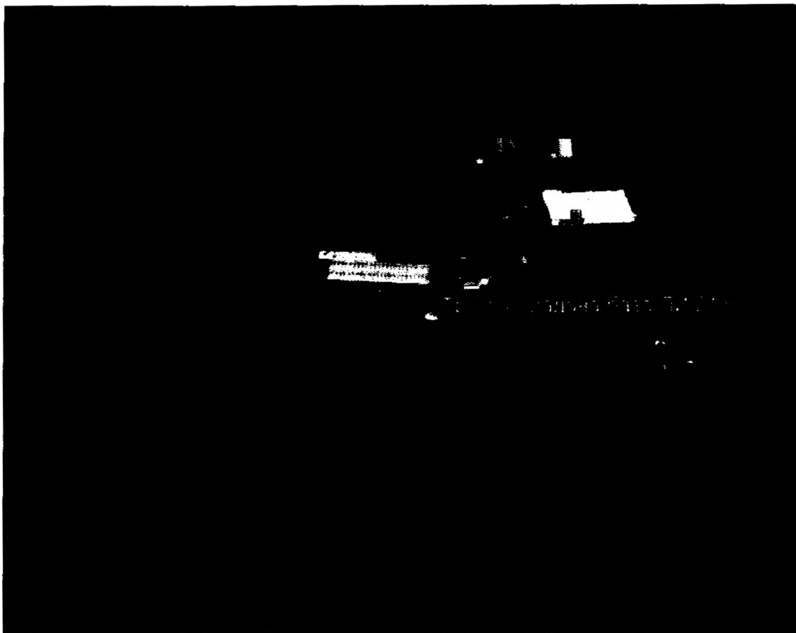
Фиг. 2. Местоположение на проектирания тръбен кладенец

Водата от тръбния кладенец ще се използва за техническо водоснабдяване (други цели).