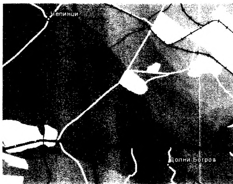
Фиг. 4. Карта на защитена зона „Рибарници Челопечене“ с код BG 0002114

При реализацията на инвестиционното предложение в имота, който не попада в границата на защитена зона от екологичната мрежа Natura 2000, не се очаква пряко и косвено унищожаване на природните местообитания, както и местообитания на приоритетни за опазването на животински видове, които са предмет и цел на опазване в горесцитираните защитени зони.