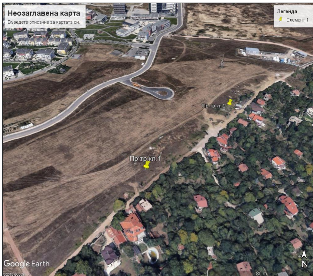
Фиг. 1. Местоположение на тръбните кладенци

Захранването на обекта с електроенергия ще бъде осъществено от електропреносната мрежа.