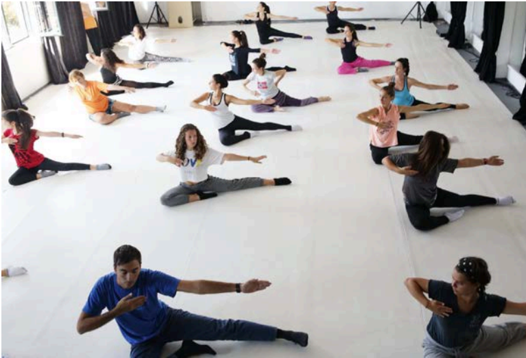
Танцов клас в Derida Dance Center

от тях навлизат и в професионалната сцена. Танцовата сцена привлича хора и от редица други професии за преките цели на своето производство и функциониране в културната среда – сценографи, костюмографи, драматурзи, композитори, осветители, техници, представители на различни изкуства и области – музика, визуални и дигитални изкуства, културни теоретици, критици, творчески мениджъри, ПР-и, дизайнери и др., които също работят в нея на свободна практика. Това посочва нарастващото внимание, което трябва да се отделя на ролята на свободната творческа сцена по отношение на трудовия пазар, на образователните, социалните и икономическите политики.