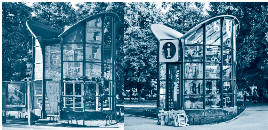
„ЧитАлнята“ в Градската градина преди и след реконструкцията на сградата ѝ

Средният живот на независимите пространства за изкуство и на организациите е между 3 и 5 години. Местата за специализирана критика намаляват, а дейността на кураторите и на културните мениджъри не се поощрява. Колекционерите и меценатите на съвременно изкуство не намират стимул за дълготраен интерес към софийската сцена. Не на последно място, всичко това ограничава публиките и отслабва социалната и демократичната роля на съвременното изкуство в обществото.