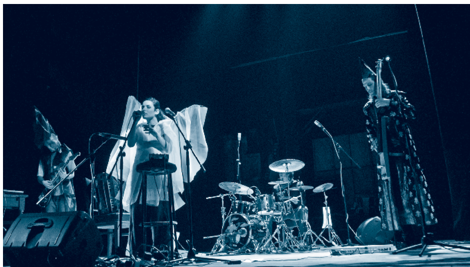
Концерт на "Насекомикс" в "Модерен Театър" 2010