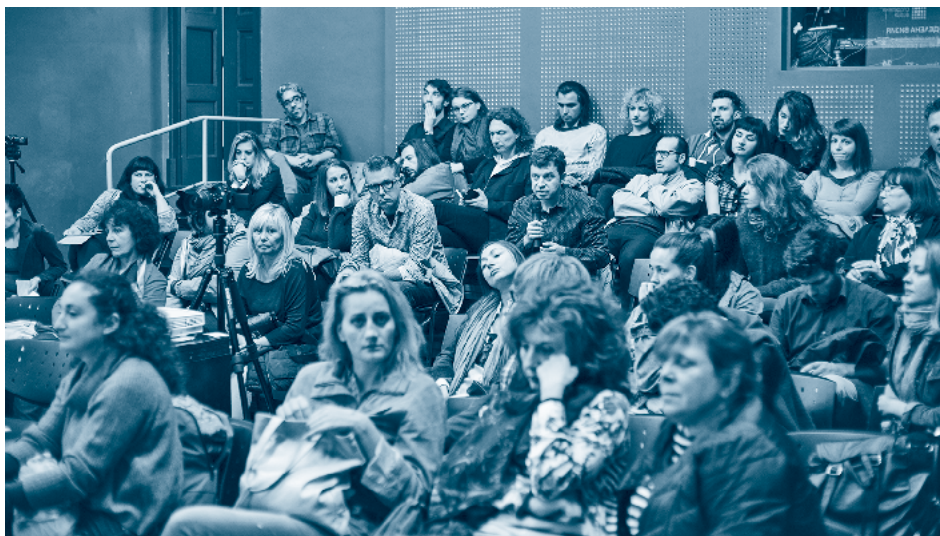
Финално обществено представяне „Споделена Визия“, 4.10.2016 Център за култура и дебат „Червената къща“.

не на общи (за всички участници в нея) творчески и организационни цели, включително за достигане до общи публики и за анализ на процесите в сцената и социалното ѝ въздействие.