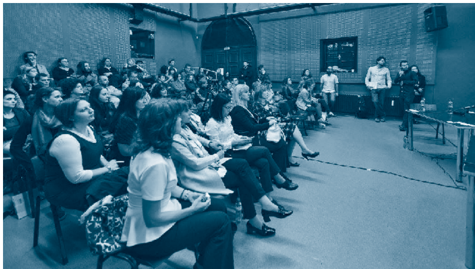
Финално обществено представяне „Споделена Визия“, 4.10.2016 Център за култура и дебат „Червената къща“.

Групите анализираха актуални документи и проведоха свои допълнителни консултации. Те използваха анкетното проучване, експертния анализ на европейски практики и свои канали, за да формират обща визия относно три свързани теми на проявление на сцената: Талант; Технология и Споделяне. (Виж Приложение 1) Синхрон в анализа внесе общата изходна дефиниция на свободната сцена за изкуства в София, изградена от екипа на проекта съвместно с участници във фокус групите.