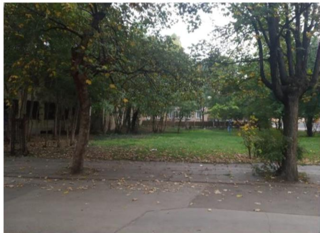
Сегашно състояние на имота

мерки - осъществяването на конференции и събития за популяризиране на наградата „Зелена столица на Европа“.