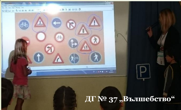
ДГ № 37 „Вълшебство“