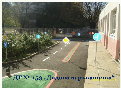
ДГ № 153 „Дядовата ръкавичка“