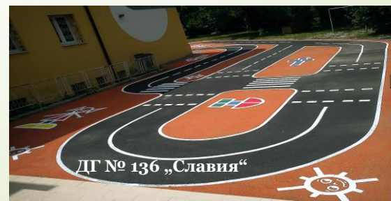
ДГ № 136 „Славия“