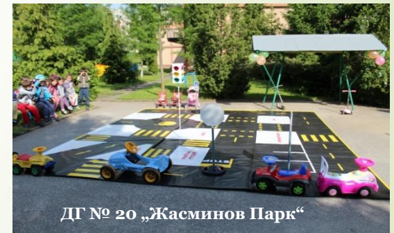
ДГ № 20 „Жасминов Парк“