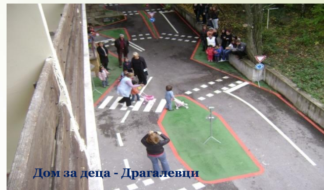
Дом за деца - Драгалевци