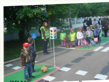
ДГ № 79 „Слънчице“.