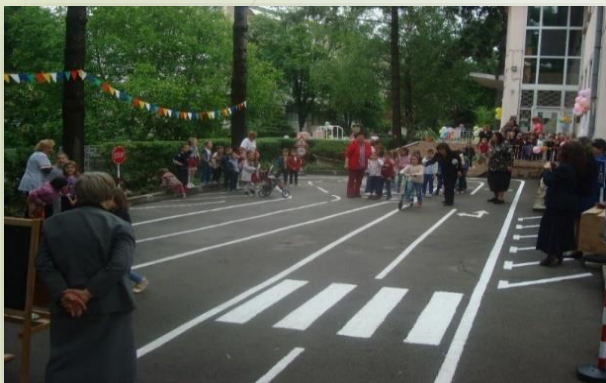
ДГ № 90 „ВЕСА ПАСПАЛЕЕВА“