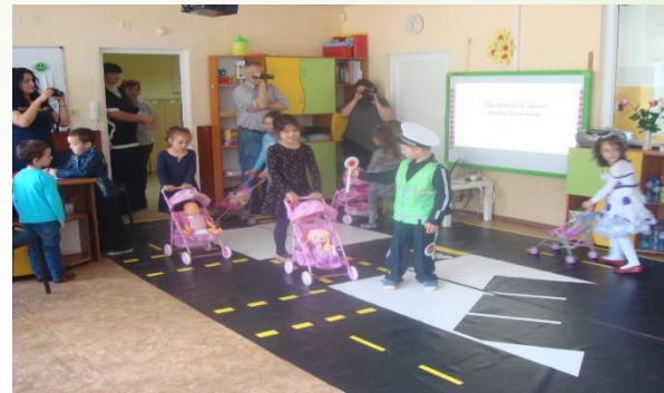
ДГ № 12 „Лилия“