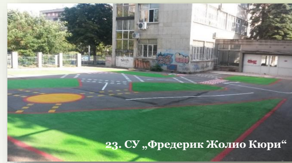
23. СУ „Фредерик Жолио Кюри“