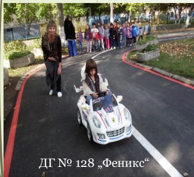
ДГ № 128 „Феникс“