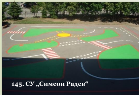
145. СУ „Симеон Радев“