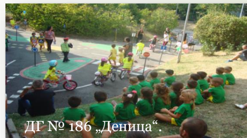
ДГ № 186 „Деница“.