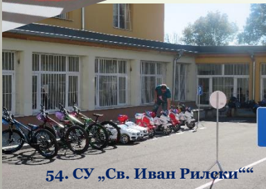
54. СУ „Св. Иван Рилски“