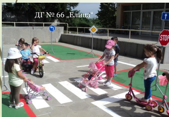
ДГ № 66 „Елица“