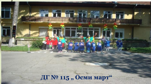
ДГ № 115 „Осми март“