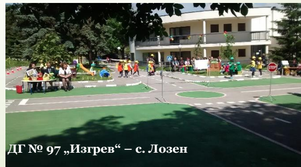
ДГ № 97 „Изгрев“ – с. Лозен