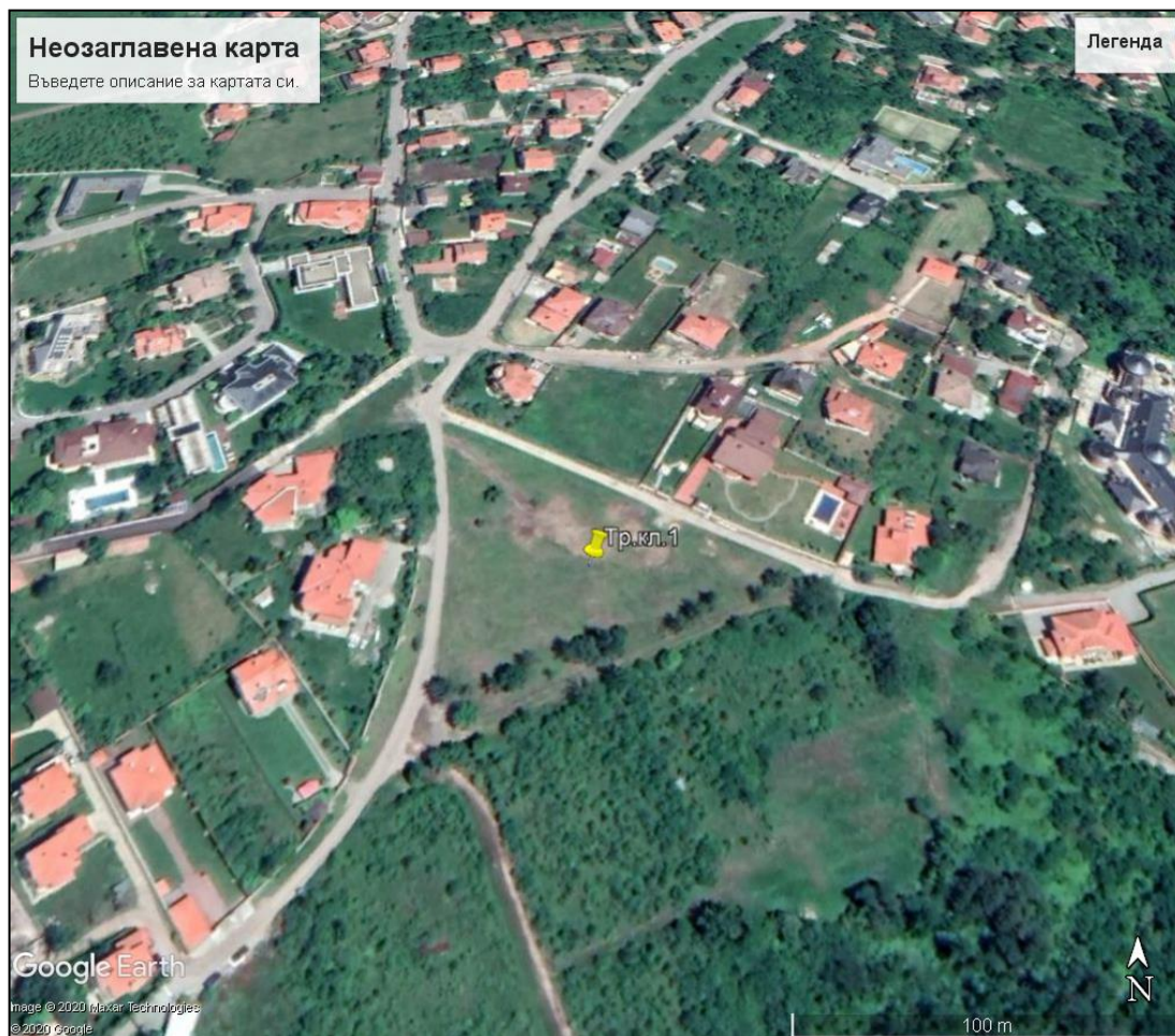
Фиг. 1. Местоположение на тръбния кладенец

Захранването на обекта с електроенергия ще бъде осъществено от електропреносната мрежа.