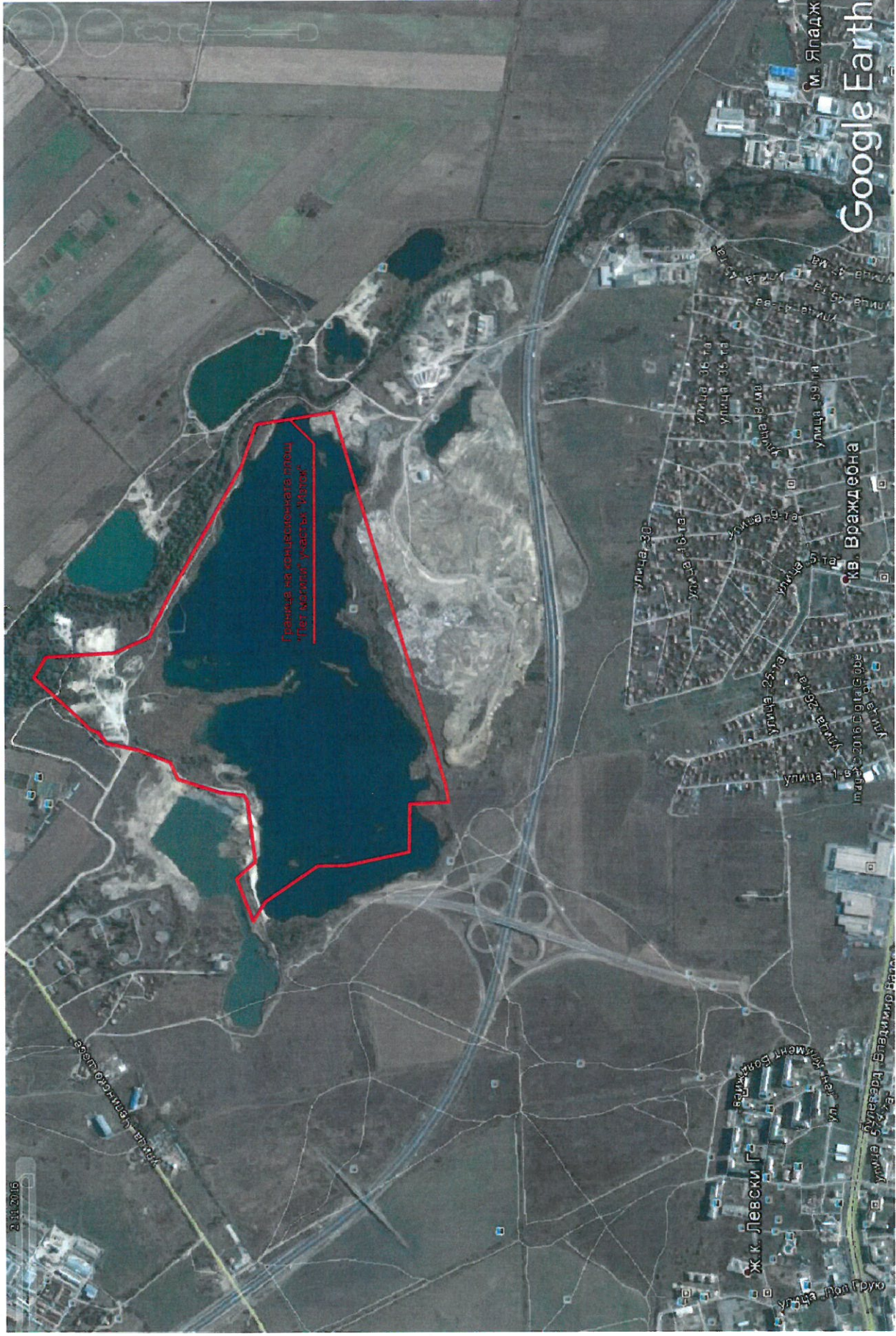
Приложение №1. Местоположение на карьера „Пет могили-изток“ и граница на концесийната площ