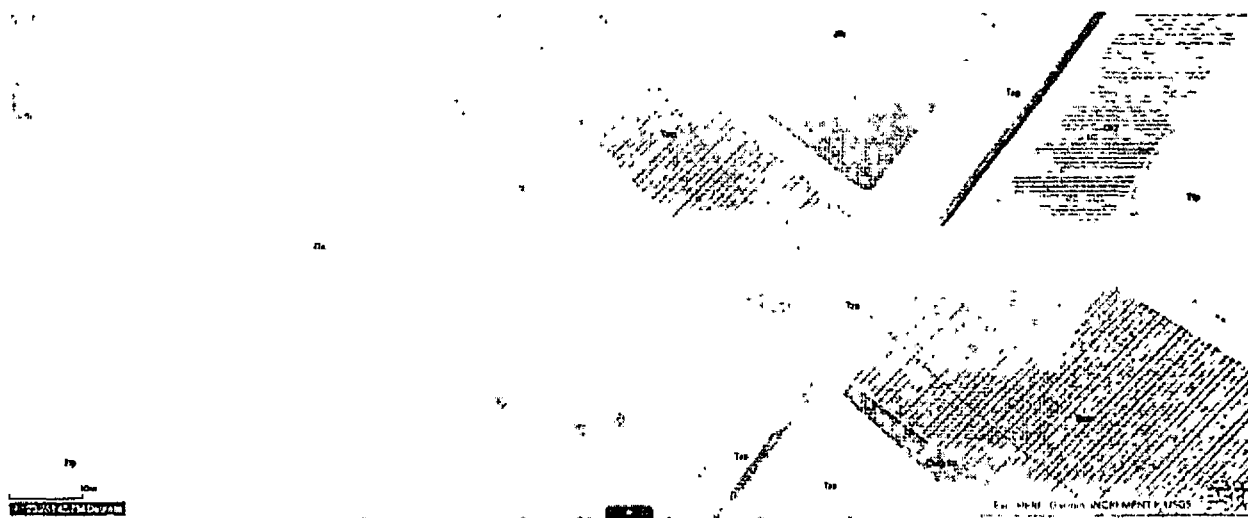
Фиг.2. Извадка от скица на имота