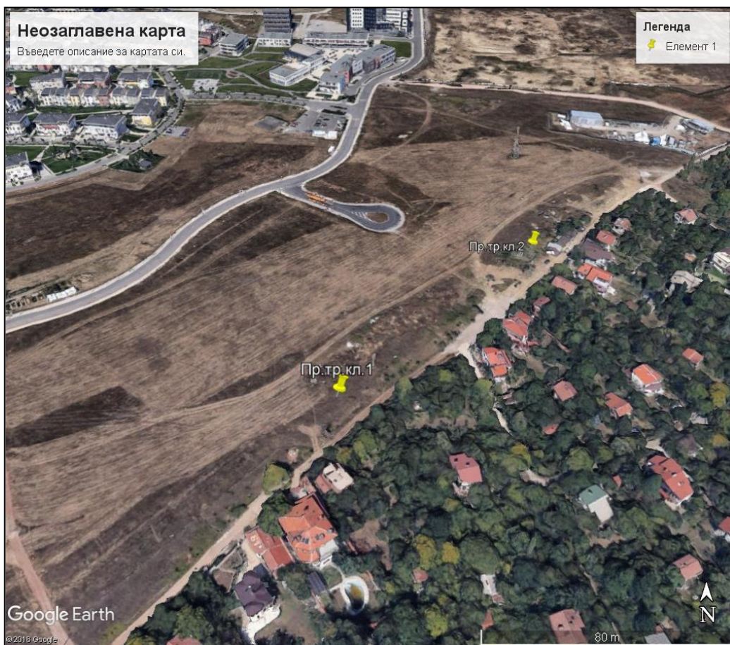
Фиг. 2. Местоположение на тръбните кладенци

Мястото на бъдещите тръбни кладенци е определено както следва: