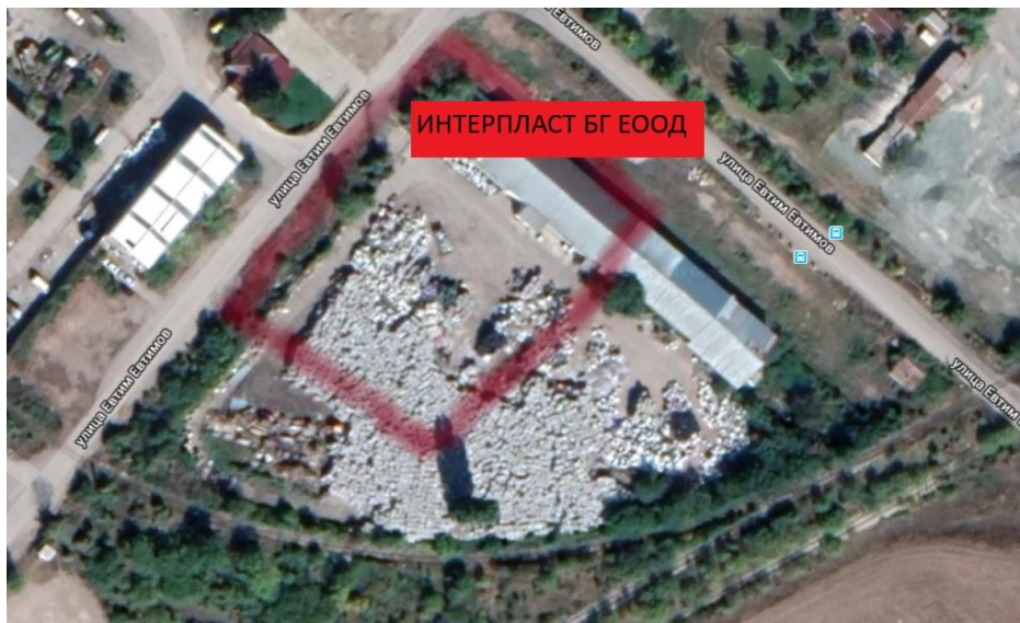
Фиг. 1 – Сателитна снимка

В непосредствена близост до площадката на инвестиционното предложение няма разположени елементи на Националната екологична мрежа.