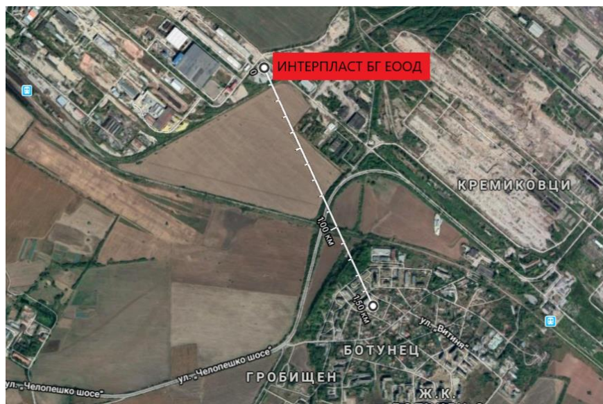
Фиг. 2 – Сателитна снимка с най- близко отстояние до населено място

В непосредствена близост до площадката няма разположени обекти подлежащи на здравна защита. Най-близкото населено място е на отстояние 1,5 км.