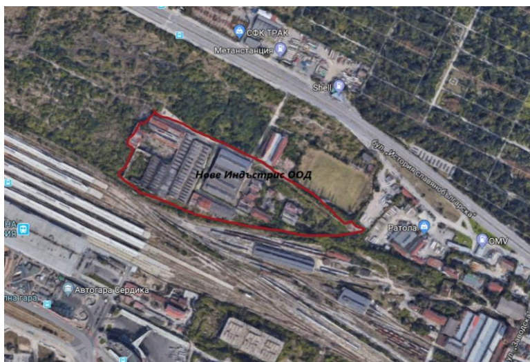
Фиг. 1 – Сателитна снимка

На фиг. 1 е представена сателитна снимка с отчертани граници в червен цвят, която дава информация за физическите, природните и антропогенни характеристики на обекта.