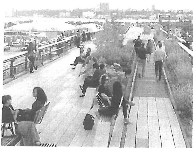
Ню Йорк, САЩ