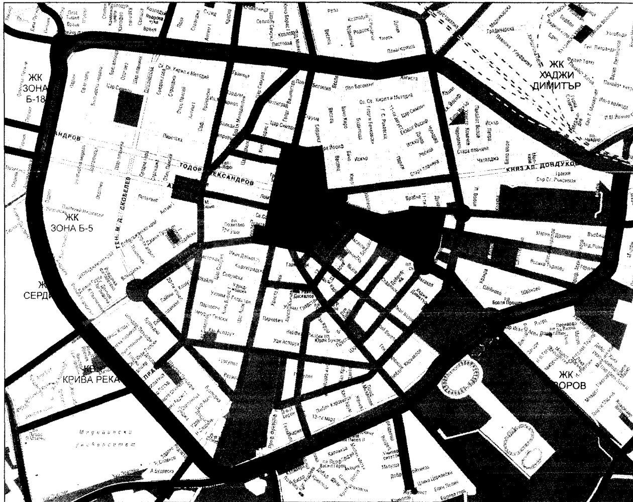
Схема № 1 към Приложение № 2