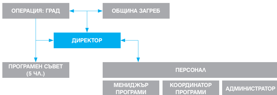
Фиг. 2. Управленска структура на ПОГОН

основен и управляван съвместно от алианса Операция Град и Община Загреб. 21 Този модел предлага дългосрочна перспектива, тъй като балансира между публично финансиране и наблюдение, от една страна, и независимо програмиране и съвместно вземане на решения, от друга, с равноправно участие. Битката на Операция Град за свободните постиндустриални пространства започва преди повече от 10 години. 22 Един от безусловните им успехи е постигнатото споразумение с Община Загреб през 2008 г. за създаване на център ПО-ГОН в сградата на бившата фабрика Jedinstvo с годишен бюджет за издръжка 1,2 милиона куни (около 170 000 евро).