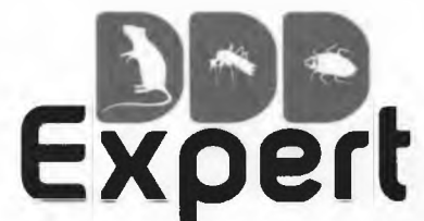
ГРАФИК ЗА ПРОВЕЖДАНЕ НА МЕРОПРИЯТИЯ ПО КОНТРОЛ НА КОМАРИ