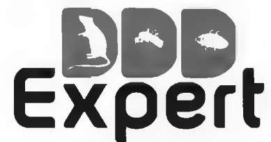
ГРАФИК ЗА ПРОВЕЖДАНЕ НА МЕРОПРИЯТИЯ ПО КОНТРОЛ НА ГРИЗАЧИ