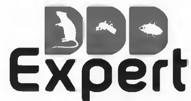
ГРАФИК ЗА ПРОВЕЖДАНЕ НА МЕРОПРИЯТИЯ ПО КОНТРОЛ НА КЪРЛЕЖИ