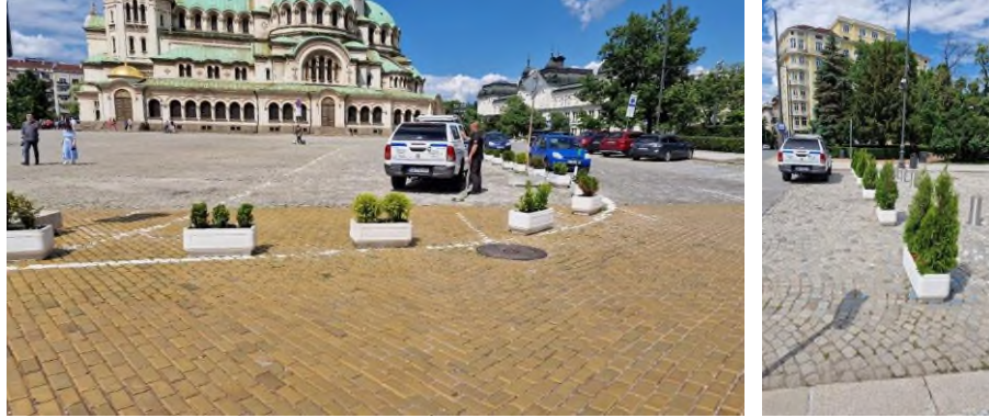
Премахване на коли бул. „Патриарх Евтимий“